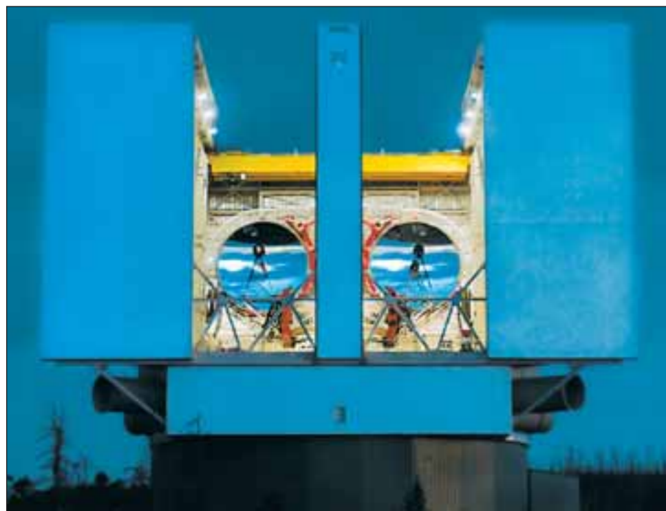
Large Binocular Telescope (LBT) in Arizona: Die beiden Spiegel mit je 8,4m Durchmesser wirken gemeinsam wie ein Teleskop mit 12 Meter Spiegel Durchmesser. Die Position der beiden Teleskope ist so gewählt, dass sich der Abendhimmel darin spiegelt.